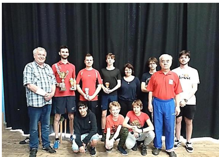
Fotky účastníků turnajů z roku 2024 a 2025